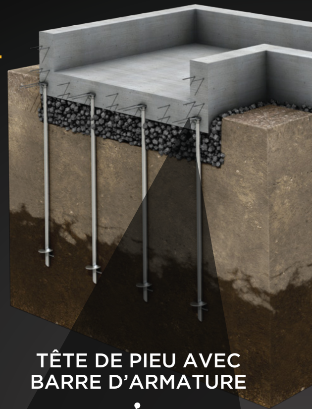
TÊTE DE PIEU AVEC BARRE D'ARMATURE

Comparativement à d'autres solutions, l'utilisation de pieux vissés vous fera économiser des milliers de dollars !